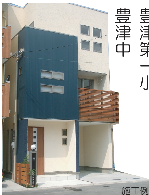
豊津中 豊津第一小 施工例