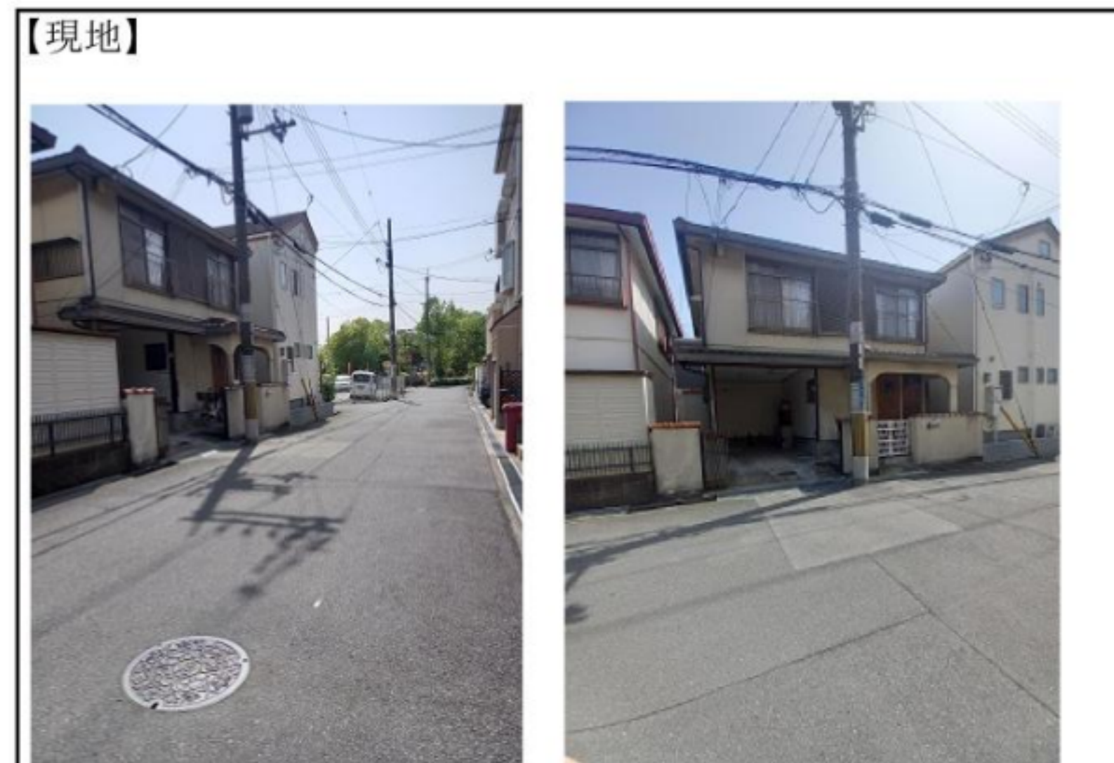
佐井寺南が丘公園