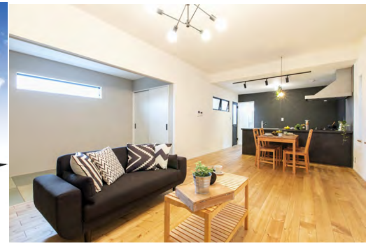
リビング(当社施工例)