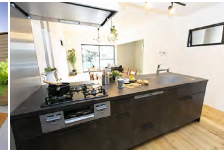
キッチン(当社施工例)