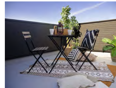
バルコニー(当社施工例)