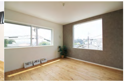
主寝室(当社施工例)