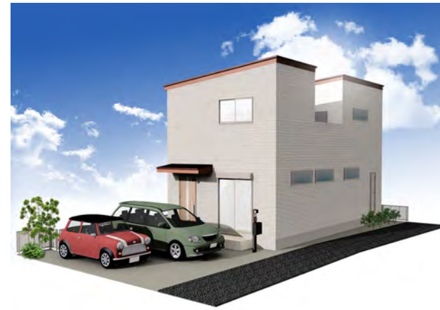
外観イメージパース